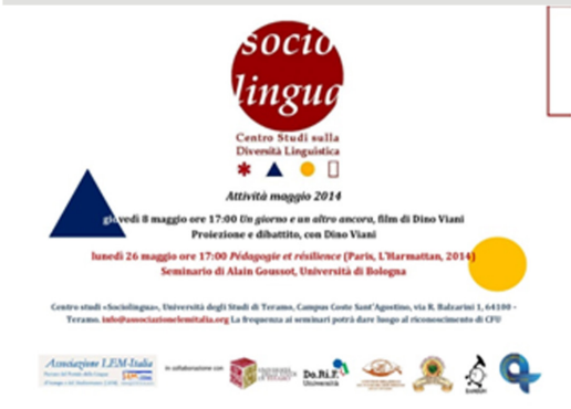
Maggio Primo Ciclo Seminari Sociolinguistics