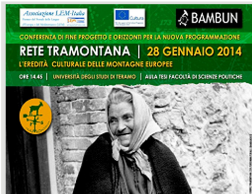
Gennaio Consuntivo Réseau Tramontana