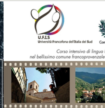
Luglio UGFIS a