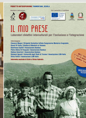
Ottobre Tramontana Scuola Montorio al Vomano