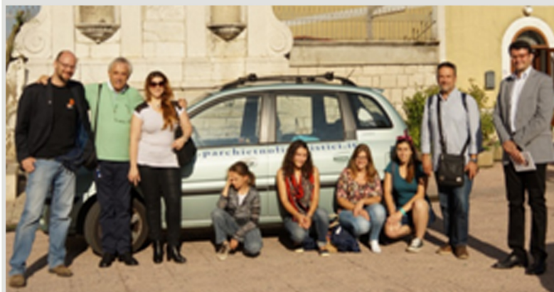
Agosto - Settembre Seconda Carovana della Memoria e della Diversità Linguistica