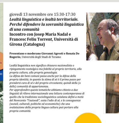
Novembre Ciclo di Incontri Sociali "In difesa dei beni com"

Andando sempre avanti... Felice e proficuo 2015!