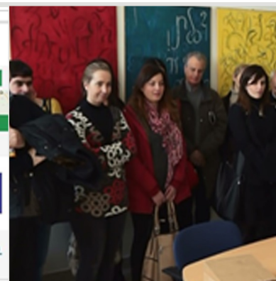
Marzo "Sociolinguistics" Centro Studi sulla