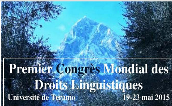
Giugno Lancio Primo Congresso Mondiale Diritti Linguistici